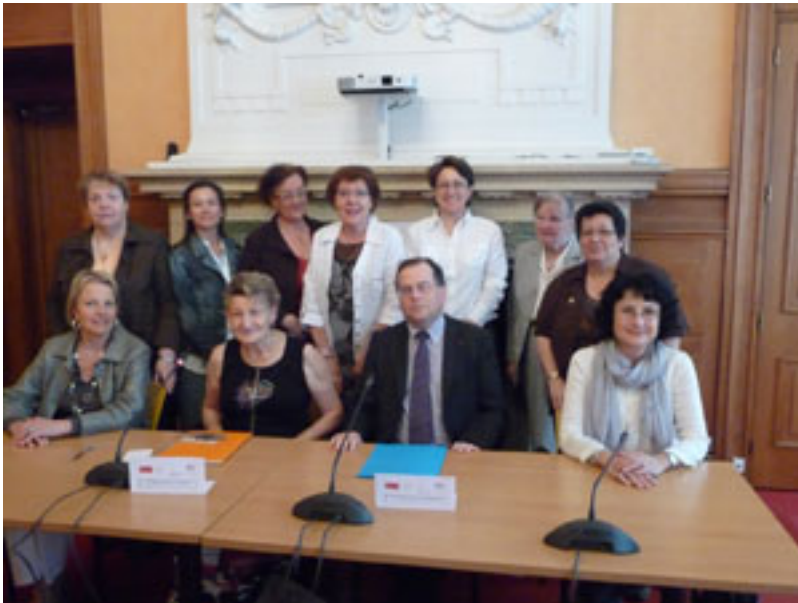
Commission de la parité" et quelques membres de l'association

Quant aux prochaines élections législatives, les six députés sortants de droite comme de gauche, ont tous des femmes.